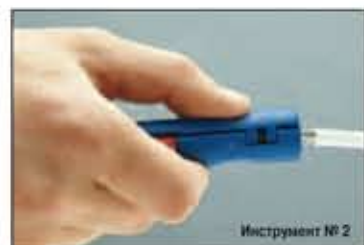
Инструмент № 2