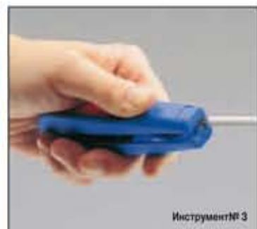
Инструмент № 3