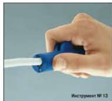
Инструмент № 13