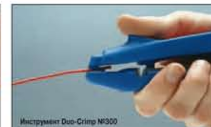
Инструмент Duo-Crimp №300