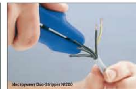
Инструмент Duo-Stripper №200