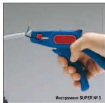
Инструмент SUPER № 5