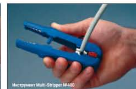
Инструмент Multi-Stripper №400